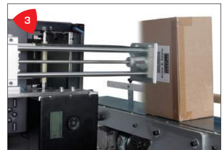
3 Versátil, aplica etiquetas desde arriba, abajo, de forma lateral, en cualquier ángulo de rotación.