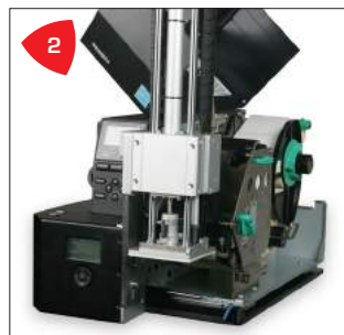
2 Compacto, seguro y de fácil acceso para el usuario.